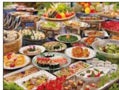
懇親会は立食ビュッフェ形式です (お料理、ドリンク飲み放題)。